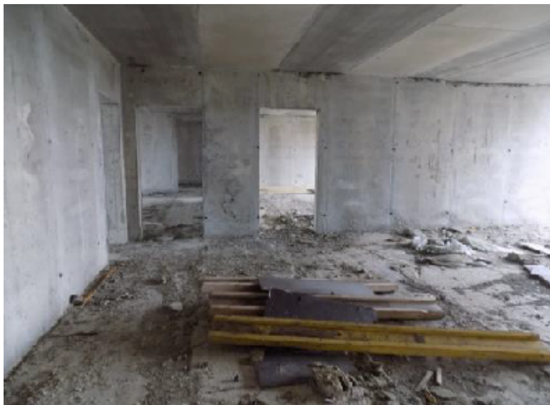
Фото внутренних помещений 9 этажа