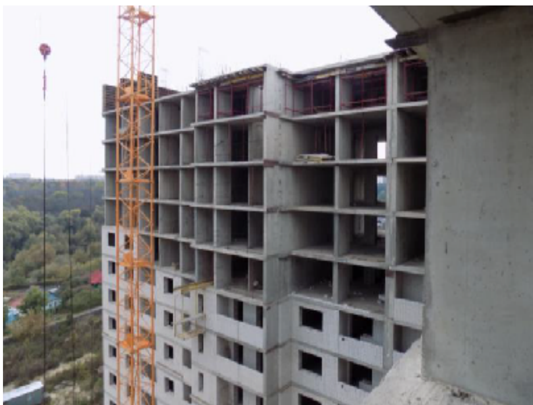
Фото железобетонных конструкций